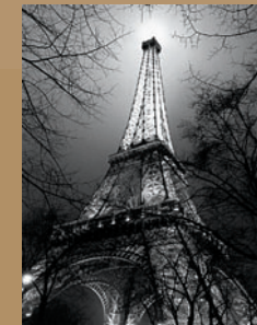
Antoine CARRARA Sa majesté la Tour Eiffel